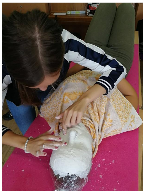
Ukázka z kreativních seminářů - třída 2.MD