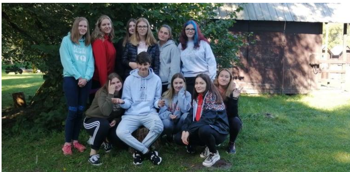
Třída 1.VS na adaptačním semináři