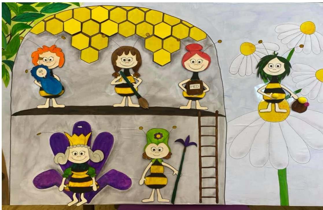
Ukázka maturitní práce oboru Předškolní a mimoškolní pedagogika

Výuka v jednotlivých oborech i ročnících se řídí školními vzdělávacími programy.