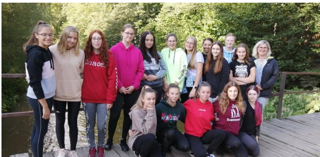
Třída 1.MD na adaptačním semináři

Za body získané tímto sběrem je možné získat různé pomůcky do školy. V tomto školním roce body zatím shromažďujeme, využijeme je až v roce následujícím.