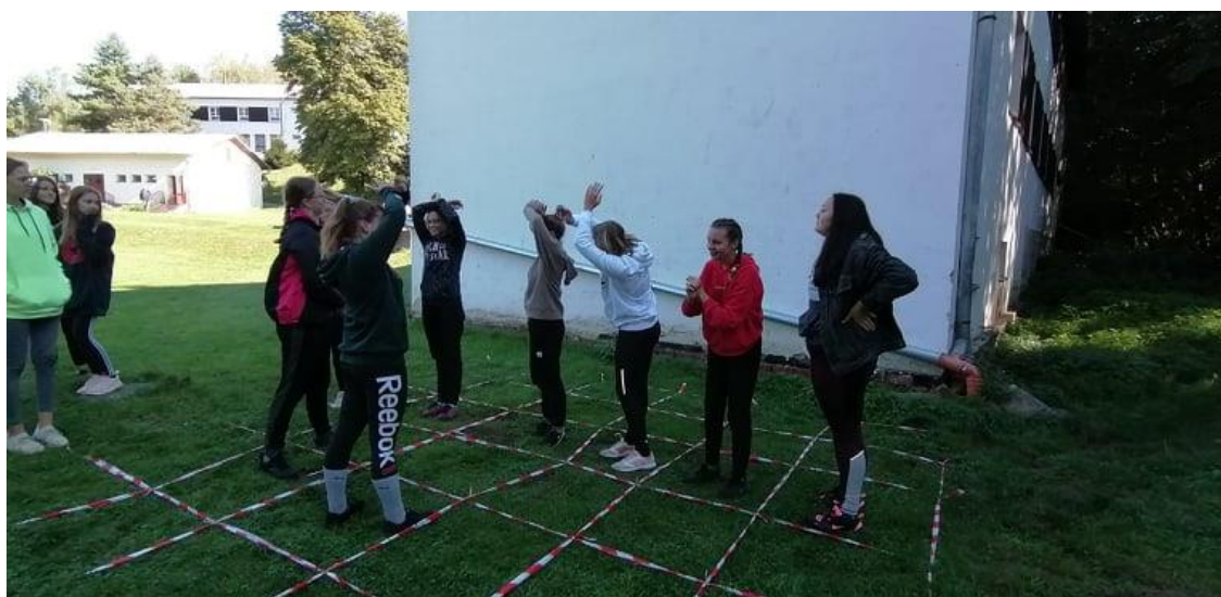
Ukázka z adaptačního semináře

Škola je nadále zapojena do SVI - systém včasné intervence.