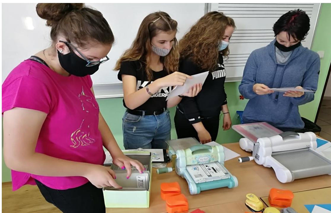
Kreativní seminář třídy 2.MD