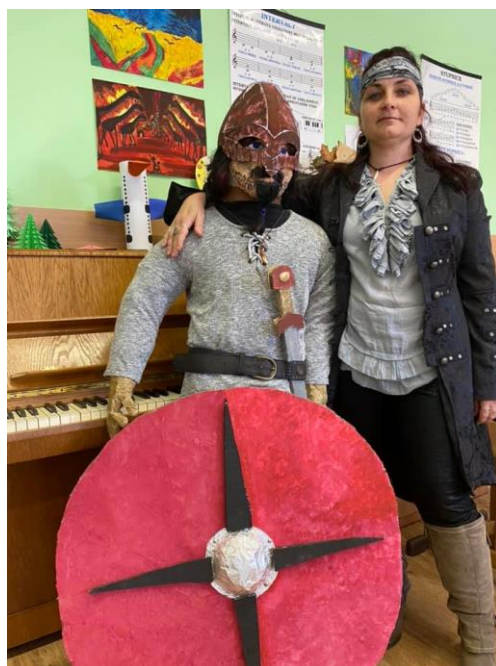
Obhajoby maturitních prací oboru Předškolní a mimoškolní pedagogika